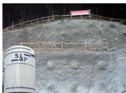
Openbare werken (taluds, ravijnen, keermuren)