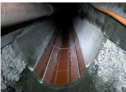
Ingegraven netwerken (rioleringen)