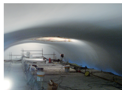
Historische bouwwerken (metselwerk)